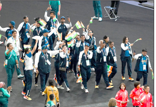
ಪ್ಯಾರಿಸ್ ಕ್ರೀಡಾಕೂಟದ ಸಮಾರೋಪ ಸಮಾರಂಭದಲ್ಲಿ ಭಾರತದ ದ್ವಿಭಾಷಿಣಿ ಶೂಟರ್ ಮನು ಭಾಕರ್ ಹಾಗೂ ಹಾಕಿ ತಂಡದ ಗೋಲ್ ಕೀಪರ್ ಶ್ರೀಜೇಶ್ ಕಾಣಿಸಿಕೊಂಡಿದ್ದರು.

ಜತೆಗೆ ಈ ಒಲಿಂಪಿಕ್ ನಲ್ಲಿ ಬೆಳ್ಳಿ ಪದಕ ಗೆದ್ದ ಏಕೈಕ ಭಾರತೀಯ ಅಥ್ಲೀಟ್ ಆಗಿದ್ದಾರೆ. ಜಾವೆಲಿನ್ ಎಸೆತದ ಫೈನಲ್‌ನಲ್ಲಿ ಅವರು ತಮ್ಮ ಎರಡನೇ ಪ್ರಯತ್ನದಲ್ಲಿ 89.45 ದೂರಕ್ಕೆ ಭರ್ಜಿ ಎಸೆದು ಪದಕ ಮುಡಿಗೇರಿಸಿಕೊಂಡರು. ಇದನ್ನು ಹೊರತುಪಡಿಸಿ, ಅವರ ಇತರ 5 ಎಸೆತಗಳು ಪೌಲ್ ಆಗಿದ್ದವು. ಈ ಈವೆಂಟ್ ನಲ್ಲಿ ಪಾಕಿಸ್ತಾನದ ಜಾವೆಲಿನ್ ಎಸೆತಗಾರ ಅರ್ಷದ್ ನದೀಮ್ 92.97 ಮೀಟರ್ ದೂರಕ್ಕೆ ಭರ್ಜಿ ಎಸೆದು ಚಿನ್ನದ ಪದಕಕ್ಕೆ ಭಾರತೀಯರನ್ನು ಸವಿಯಿತು. ಒಲಿಂಪಿಕ್‌ನಲ್ಲಿ ಭಾರತ ಹಾಕಿ ತಂಡದ ಗೋಲ್ ಕೀಪರ್ ಆಗಿ ತಂಡದ ಗೆಲುವಿಗೆ ಕೊಡುಗೆ ನೀಡಿದ ಶ್ರೀಜೇಶ್ ಅವರ ಎಕ್ಸ್ ಖಾತೆಗೂ ಐಫೆಲ್ ಟವರ್ ಸ್ಟಿಕ್ ಸೇರಿಸಲಾಗಿದೆ. ಈ ಬಾರಿಯ ಒಲಿಂಪಿಕ್ ನಲ್ಲಿ 117 ಕ್ರೀಡಾಪಟುಗಳು ಭಾರತವನ್ನು ಪ್ರತಿನಿಧಿಸಿದ್ದರು. ಈ ಪೈಕಿ ಮನು ಭಾಕರ್, ಸರಬ್ಜೋತ್ ಸಿಂಗ್, ಸ್ವಪನೀಲ್ ಕುಸಾಲೆ, ನೀರಜ್ ಚೋಪ್ರಾ ಮತ್ತು ಭಾರತ ಹಾಕಿ ತಂಡ ಮಾತ್ರ ಪದಕ ಗೆಲ್ಲುವಲ್ಲಿ ಯಶಸ್ವಿಯಾಗಿದೆ. ಉಳಿದ ಆಟಗಾರರು ಉತ್ತಮ ಪ್ರದರ್ಶನ ತೋರಿದರಾದರೂ ಅಂತಿಮ ಹಂತದಲ್ಲಿ ಎಡವಿ ಪದಕವಿಲ್ಲದೇ ಖಾಲಿ ಕೈಯೊಂದಿಗೆ ಸ್ವದೇಶಕ್ಕೆ ಮರಳಿದ್ದಾರೆ. ಒಟ್ಟಾರೆ ಈ ಬಾರಿ ಭಾರತ 6 ಪದಕಗಳನ್ನು ಗೆದ್ದುಕೊಂಡಿದೆ.